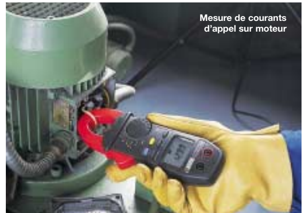
Mesure de courants d'appel sur moteur

Un fort appel de courant peut déclencher les systèmes de sécurité, voire endommager l'installation. La fonction "Inrush current" mesure l'évolution du courant de démarrage moteur, sans nécessité de visualisation graphique, et définit les relations amplitude-temps de la protection moteur.